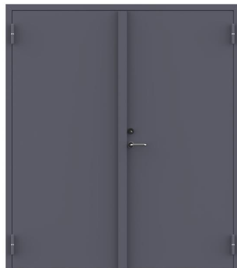
Karmin tyyppi YM

Ovea on tarkistettava ja huollettava vähintään kuuden kuukauden jälkeen. Tarkistettava on oven sulkeutuminen ja lukitusten toimintakunta. Tarkemmat huoltotiedot löytyvät huolto-ohjeesta. Tuotteen ostamisen aikana voidaan laatia sopimus säännöllisistä huoltotoimenpiteistä.